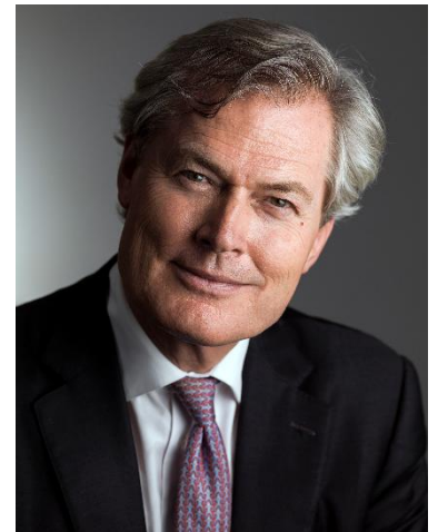
ゼリ創設者 グンターパウリ氏

「ブルーエコノミー」は「成長の限界」を克服し、「ゼロ・エミッション」を実現する、すべての人々が待ち望んでいた持続可能な21世紀の経済と環境のビジョンです。